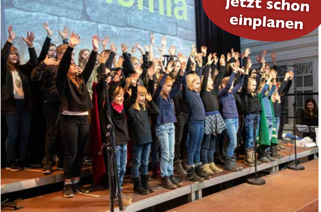
Foto von der Aufführung des Musicals Nehemia in Thalheim